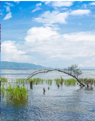
洱海 Erhai Lake