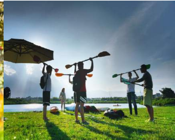
皮划艇体验 Kayak Experience