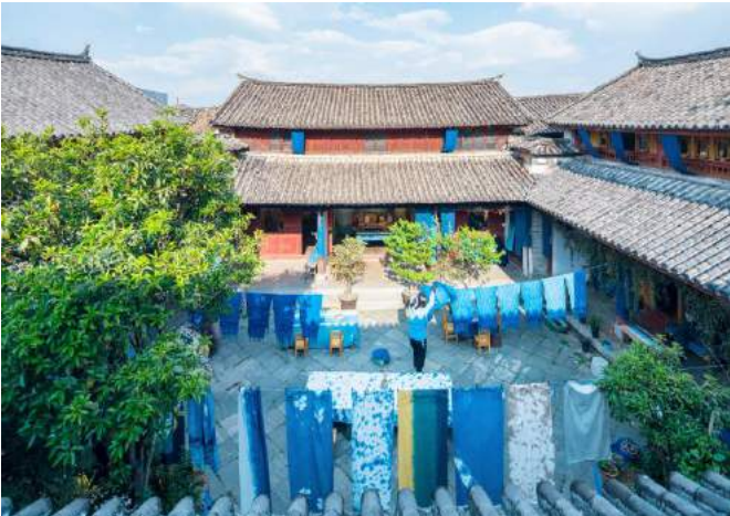
非物质文化扎染 Dali traditional Tie-Dying