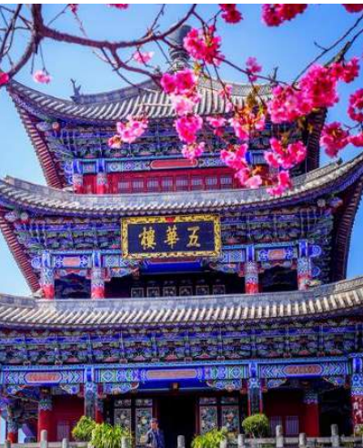
大理古城 Dali Ancient Town