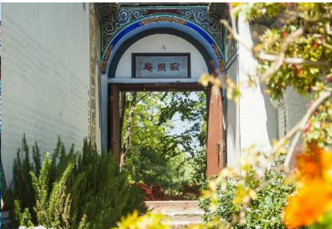
徒步苍山 Hiking in Cnagshan Mountain