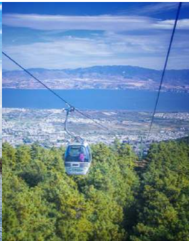
苍山 Cangshan Mountain