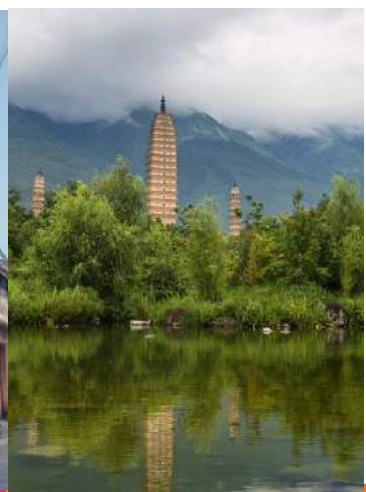
崇圣寺三塔 Chongsheng Temple

大理古城位于风光秀丽的苍山脚下，是古代南诏国和大理国的都城。又名叶榆城、紫禁城、中和镇，城内街道呈典型的棋盘式布局，是大理的旅游核心区。街巷间“三家一眼井，一户几盆花”。在这里你可以养花弄草、撸猫逗狗、逛小店、泡酒吧，尽情享受文艺时尚的慢生活。